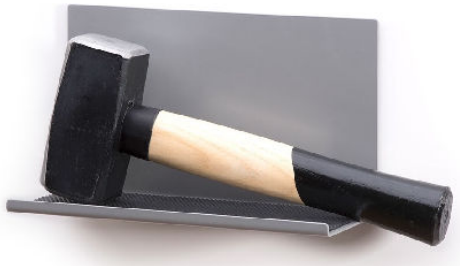
TABLETTE MAGNETIQUE avec feuille magnétique sur face arrière avec caoutchouc antidérapant 250(l)x100(p)x145(h)mm 240.99-22001