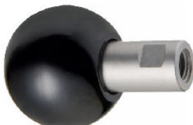
POIGNEE ACIER OU INOX A BOULE TOURNANTE BAKELITE avec taraudage