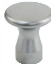
BOUTON CHAMPIGNON INOX OU ACIER avec taraudage