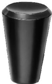
BOUTON CONIQUE THERMODURCISSABLE avec taraudage