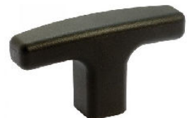
POIGNEE EN T TECHNOPOLYMERE OU ALUMINIUM avec taraudage