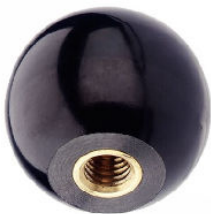
BOULE BAKELITE avec taraudage