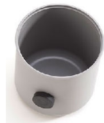
BOITE MAGNETIQUE avec 1 aimant caoutchouc pour petits outils, stylo, ... diamètre 90x85mm 240.99-21150