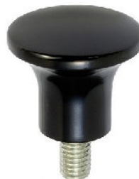
BOUTON CHAMPIGNON BAKELITE avec tige filetée