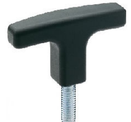
POIGNEE EN T TECHNOPLYMERE avec tige filetée