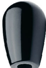
BOUTON OVALE BAKELITE avec taraudage