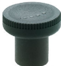
BOUTON CHAMPIGNON TECHNOPLYMERE avec taraudage