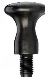
BOUTON CHAMPIGNON INOX OU ACIER avec tige filetée