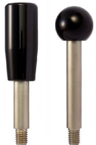
LEVIER ACIER OU INOX A BOUTON CONIQUE ROND OU OVALE BAKELITE