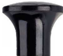
BOUTON CHAMPIGNON BAKELITE avec taraudage